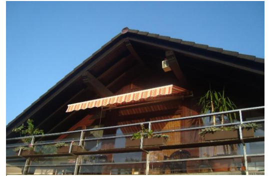
Balkon (von unten)