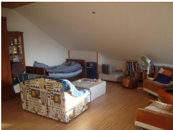
Wohn- und Schlafbereich